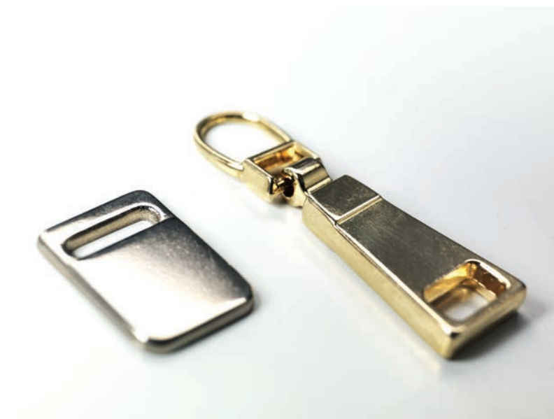
Pullers and customized metal accessories for garments. Tiretti, cursori e minuteria personalizzata per l'abbigliamento.