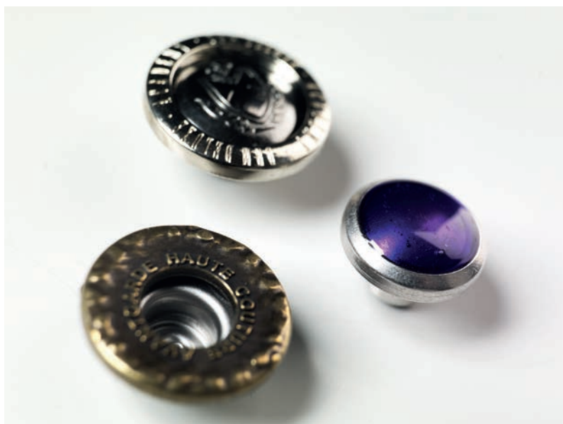
Press studs and Jeans buttons, rivets, buckles embellishing the best quality leather. Borchie, jeans, rivetti, fibbie, uniti ai migliori pellami.