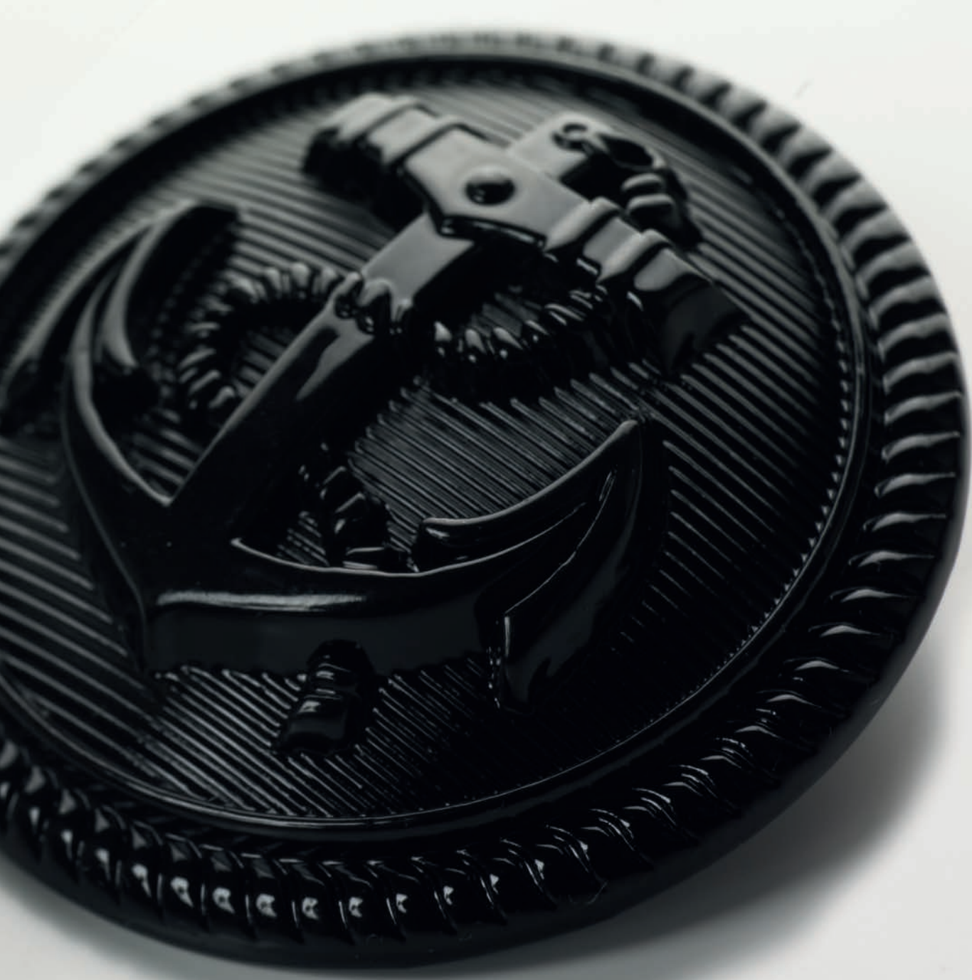
Shank Buttons. Bottoni con gambo.