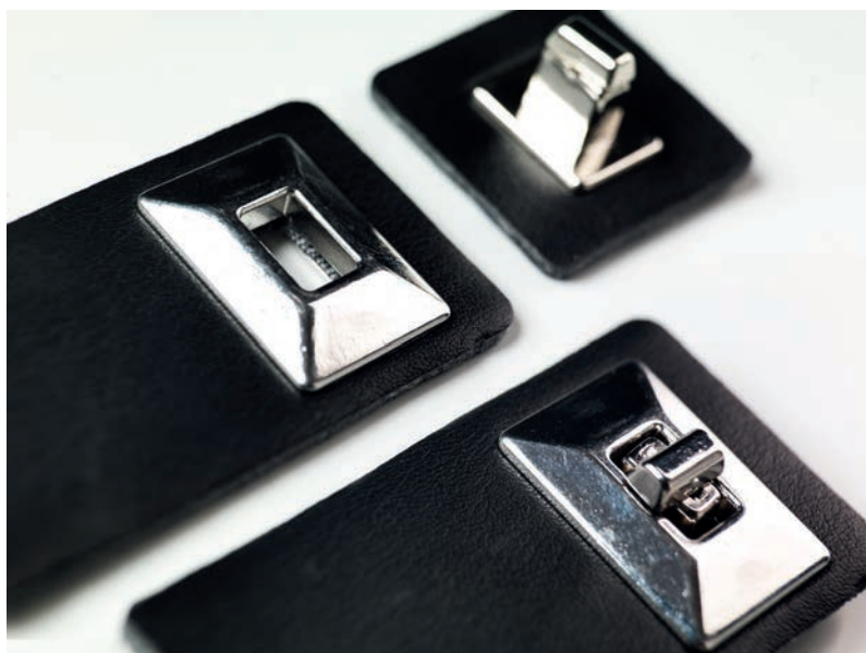
Lasered and enameled metal accessories also combined with leather. Minuterie smaltate e laserate, gestione completa all'accessorio applicato alla pelle.