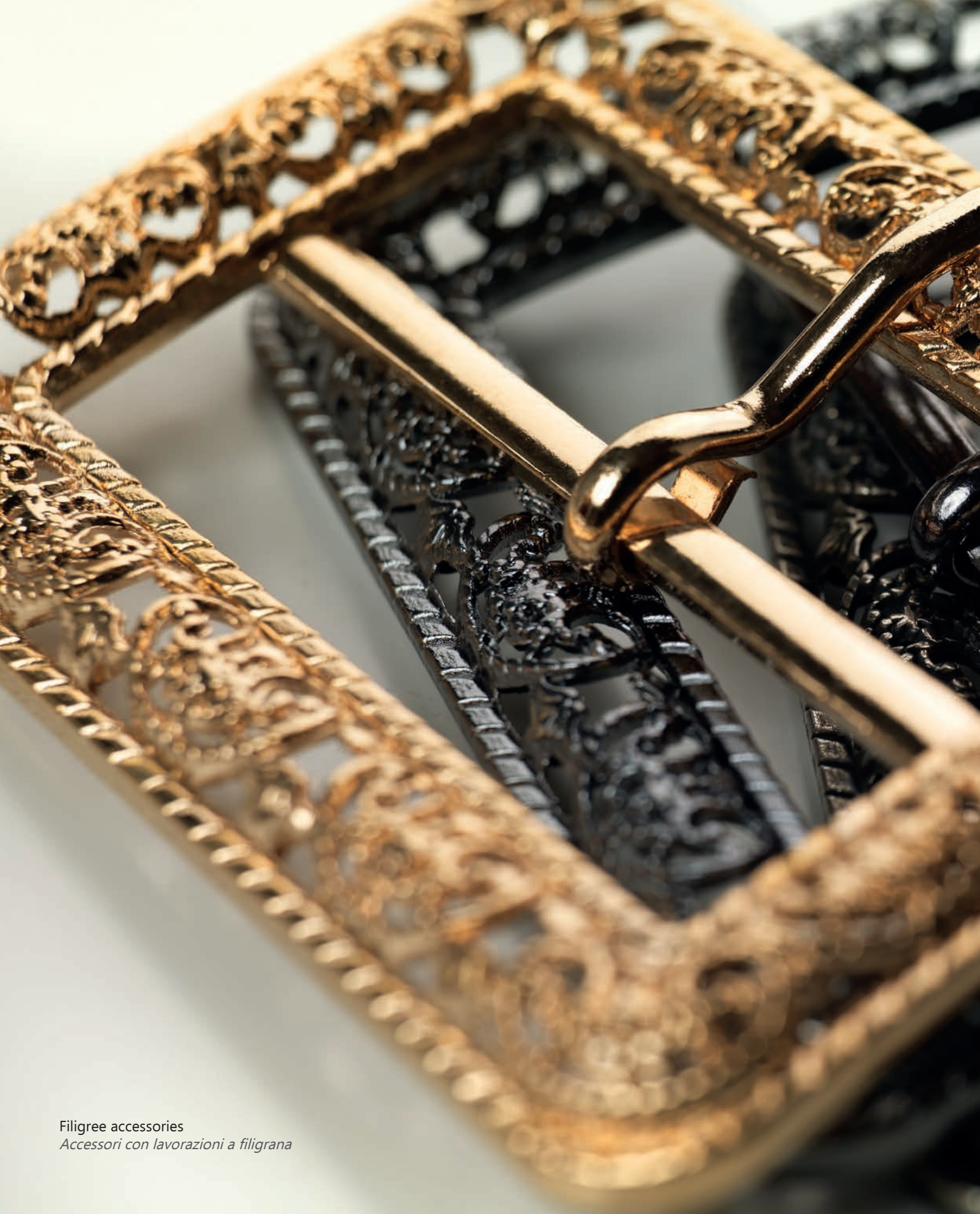
Filigree accessories Accessori con lavorazioni a filigrana