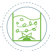
lavaggio e macinazione